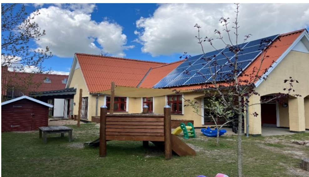
Vuggestuen på Brolæggervej Nr. 2

Børnehuset Brolæggervej er en fantastisk aldersintegreret institution, der ligger på en stor naturgrund i den Sydlige del af Sæby. Vores huse ligger på to matrikler med ca. 40 børnehavebørn i hvert hus. På Brolæggervej 2 er der ligeledes en vuggestue på 16 børn. Vores omgivelser gør, at vores pædagogiske pejlemærker er, dyr, natur og udeliv, og vi bruger vores udearealer som en store del af vores læringsmiljø. Vi har valgt, at børnene er blandet i alder på stuerne, så hver stue rummer børn fra tre år til 5 år. Dette gør vi ud fra vores grundtanke om, at det er godt at kunne spejle sig i hinanden, samt hjælpe hinanden, da de store er forbilleder for de små. Det betyder, at barnet har sin egen stue i sin børnehavetid og faste voksne på gruppen, for at en skabe en tryk og stabil base. Derudfra laver vi forskellige læringsmiljøer, hvor vi på tværs af stuerne laver aktiviteter, der er målrettet en bestemt alders gruppe fx skolegruppe på tværs af begge huse.