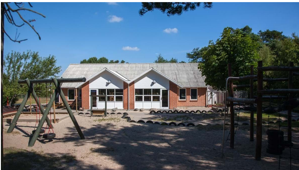
Brolæggervej Nr. 4 (Børnehaven)

Vi tilstræber at vurdere børneperspektivet i et børnemiljø, og at inddrage børns egne oplevelser af børnemiljøet ud fra deres alder og forudsætninger.