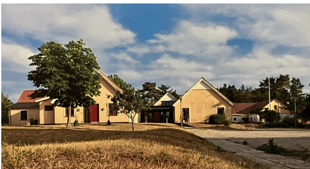
Brolæggervej Nr. 2 (Børnehave og Vuggestue)